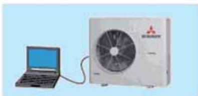
Via Mente PC is systeem uit te lezen