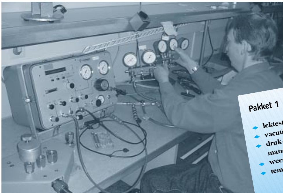
Kalibratie van manometerset in de mobiele meetwagen.