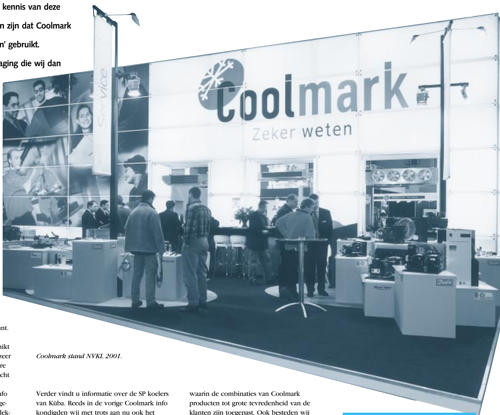
Coolmark stand NVKL 2001.

Als eerste binnen de koeltechniek beschikt Coolmark over een internetsite waar u zeer snel en eenvoudig informatie en software kunt downloaden, ook kunt u daar terecht voor het snel en voordelig plaatsen van bestellingen. Met de vorige Coolmark info en tijdens de NVKL beurs had u de mogelijkheid zich aan te melden voor onze elektronische nieuwsbrief. In deze Coolmark info aandacht voor de winnaars van de verloting van 25 ergonomische toetsenborden.