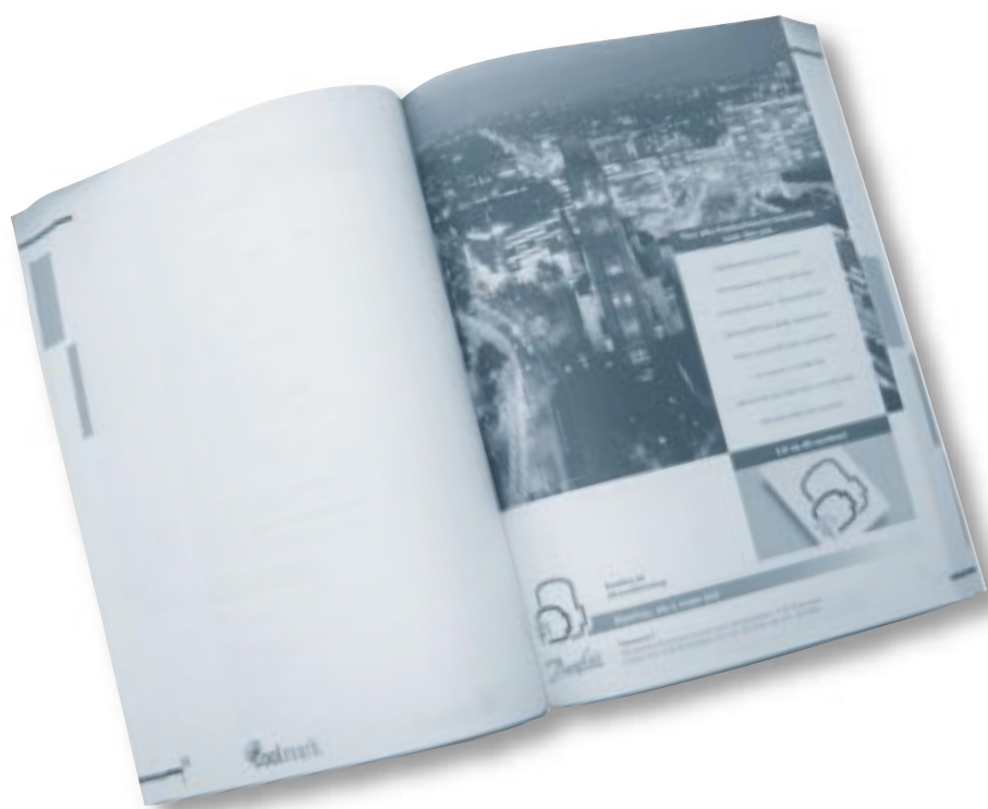
Prijslijst 2001 in een nieuw jasje.

Sommige artikelen hebben zelfs een extra kolom met informatie gekregen. Een duidelijk voorbeeld hiervan is, dat bij ECO condensoren nu het aantal ventilatoren en de vleugeldiameter worden vermeld. Door de toevoeging van de Euro-kolom is de voorraadkolom komen te vervallen. De ervaring leert dat het met behulp van ons ordersysteem goed mogelijk is vraag en voorraad op elkaar af te stemmen.