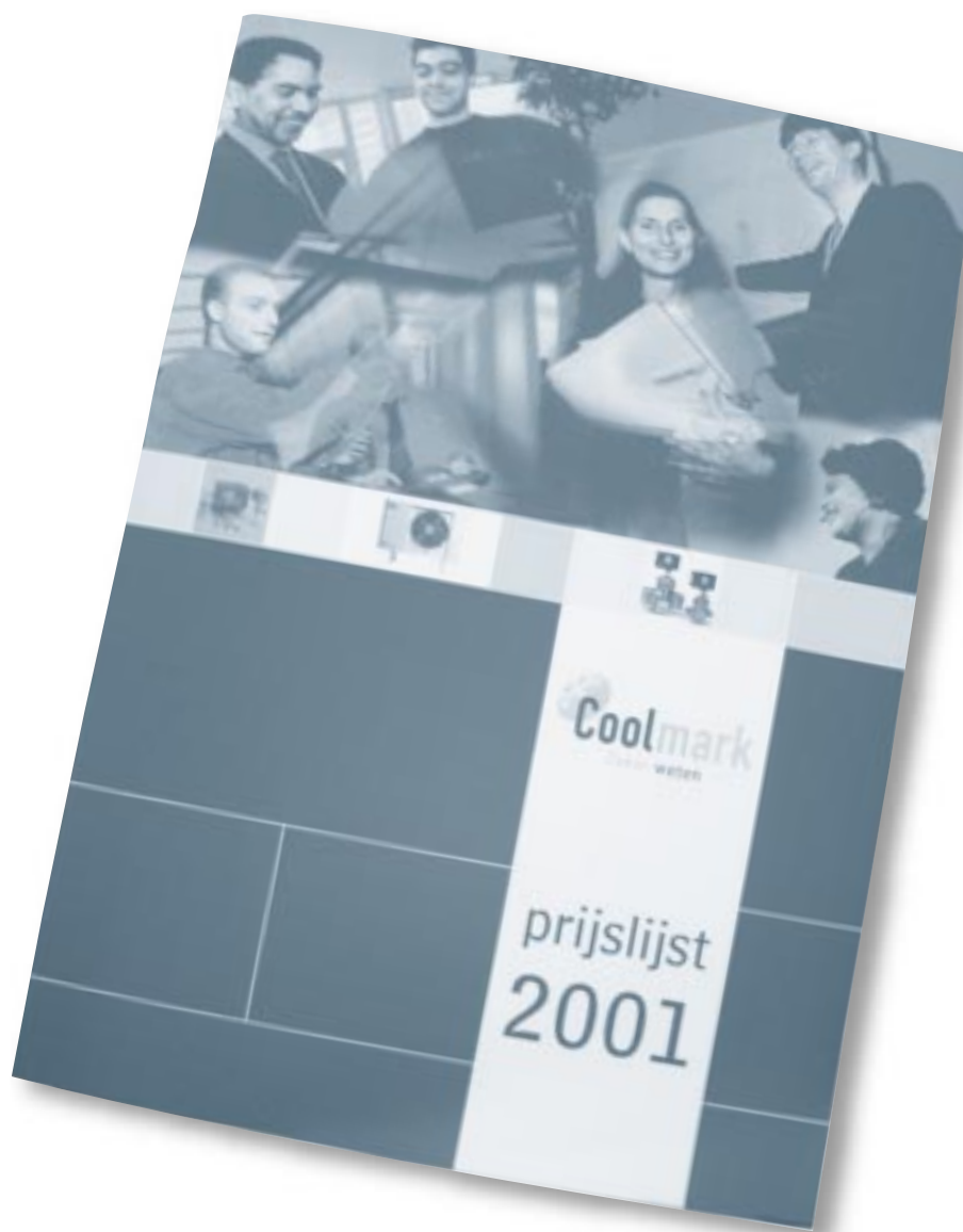
Prijslijst 2001 in een nieuw jasje.

Het was grafisch een uitdaging om zowel de prijzen in Euro als gulden in dezelfde prijslijst op te nemen, zonder aan technische informatie in te leveren. Hiermee is bovendien voorkomen dat er twee versies van de prijslijst moesten worden gedrukt, hetgeen verwarring in de hand zou hebben gewerkt.