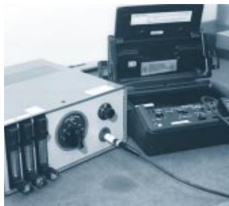
Kalibratie van een lektester.

Ook hier kan Kalibra u van dienst zijn als erkend uitvoerder van ijkwettelijke keuringen.