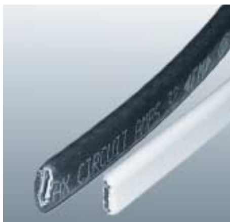
Raychem BTV2-CR en IRT Freezatrace.

Het in prijs gunstigere IRT Freezatrace is leverbaar in drie vermogens: 10W per meter (IRT-2/10), 16W per meter (IRT-2/16) en 26W per meter (IRT-2/26). Het flexibele en slanke profiel van IRT Freezatrace maakt het o.a. zeer geschikt voor toepassingen in deuren en koelmeubelen.