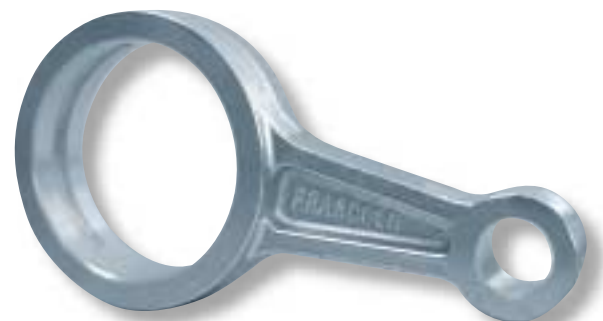
Zuigerstang met ingefreesde oliekamer.

is de toepassing van een extra oliekamer in het ronde gedeelte van de zuigerstang. In deze oliekamer bevindt zich genoeg olie om de compressor tijdens de start van voldoende smering te voorzien. In afbeelding 1 is deze eenvoudige, maar zeer doeltreffende vinding duidelijk zichtbaar. Ook al duurt het slechts tienden van seconden voordat de toegevoerde olie op gang gekomen is, juist tijdens de start is een goede smering onontbeerlijk. Voor iedere compressor geldt immers dat