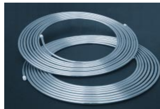
Koelleiding op rol in prijs verlaagd.

Neem de proef op de som en vraag uw nieuwe koperprijs aan.