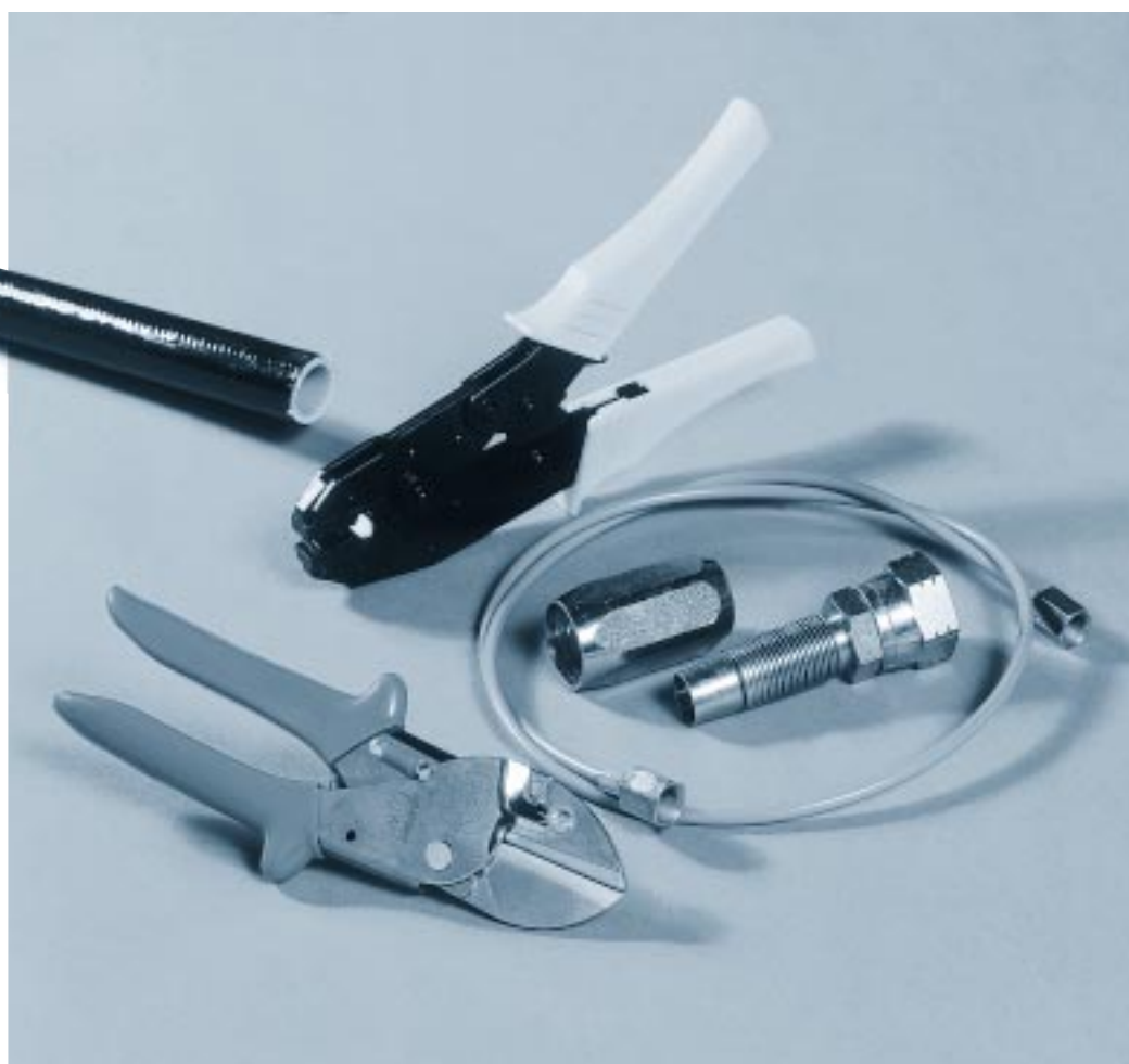
De complete range leidingwerk.

De RLK stelt eisen aan de diffusiedichtheid, vastgelegd in de zogenaamde SAE J51 norm. Deze belangrijke eigenschap wordt gemeten in grammen per meter per jaar of grammen per m 2 per jaar. De MultiflexTube overtreft de eisen van de RLK ruimschoots. De leiding is toepasbaar voor zowel vloeistof als gas met een temperatuurbereik van -40°C tot 130°C (capillaire leiding tot max. 60°C).