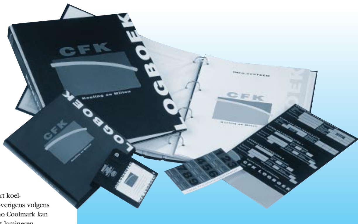
Het aangepaste logboek.

Voor meer informatie! 010-4093930 Verkoop Binnendienst